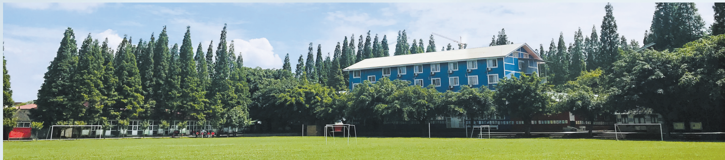
光亚学校校园内芳草萋萋绿树成荫。