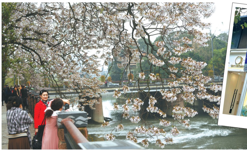
每到春天,成都红星桥府河畔泡桐花绽放,这里已经成为市区赏花打卡的“网红”之地。

如今的桂花巷仍然栽种着桂花,巷内两边树木郁郁葱葱,阳光明媚的日子里,来往车辆正密,做生意的老板就在几棵桂花树前忙碌着。每年秋天桂花盛开时节,走到巷子口,扑鼻的桂花香就扑面而来。