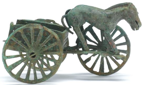
盐源龙头墓地出土的青铜马车。