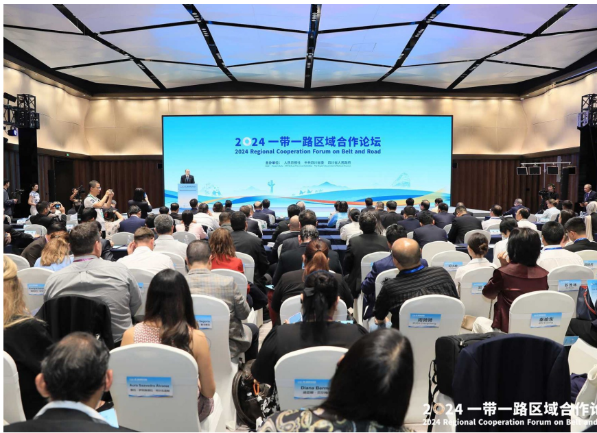
8月28日,2024“一带一路”区域合作论坛在成都举办。