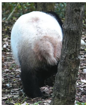
大熊猫成年后,原本细长的尾巴逐渐变成了宽宽扁扁的短尾巴。

传递信息就是大熊猫尾巴承担的一大作用。大熊猫之间的交流沟通,常常运用到气味。它们会通过肛周腺体散发的味道来传递信息。晃