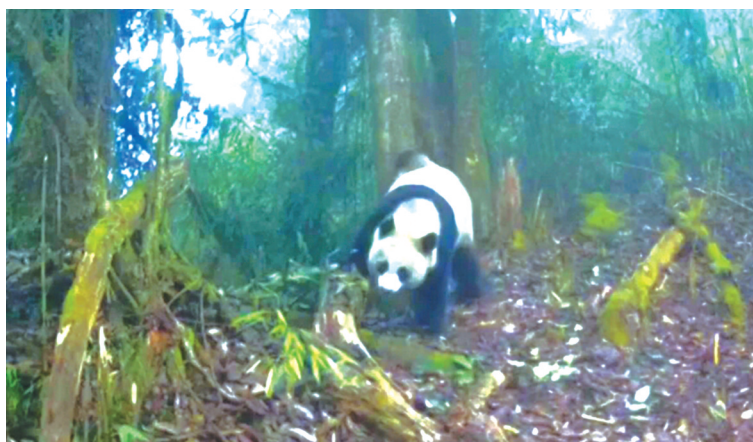
2023年2月28日,红外相机拍到的野生大熊猫正在用尾巴在树上涂抹气味做标记。 图据大熊猫国家公园眉山管理局

华西都市报-封面新闻 记者 戴竺芯 综合成都大熊猫繁育研究基地微信公众号 图片除署名外均据成都大熊猫繁育研究基地