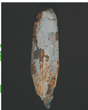
成都金沙博物馆陈列的蝉形铜器。