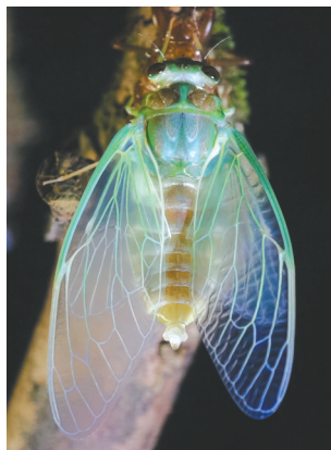
刚完成脱壳的蝉浑身青绿色。