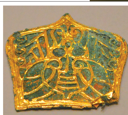
山东省临沂市博物馆展出的王羲之故居出土的西晋时期蝉纹金珰。