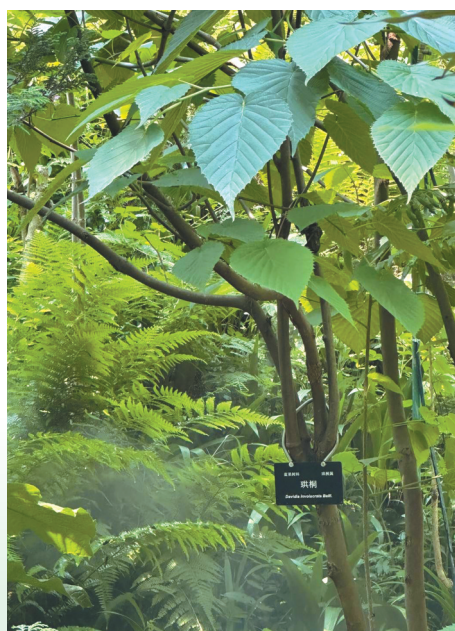
珍稀植物园内的珍稀植物珙桐。