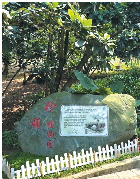
成都市植物园中的珍稀植物园。

2015年，普陀鹅耳枥的数量达到了4万株，这4万株都是那株唯一幸存者的后代或者克隆体。研究人员面临的问题是，普陀鹅耳枥仅仅是数量上多而已，严重缺乏遗传的多样性，让这种植物依然脆弱。随后，研究人员把这种植物送到全国不同地区的13个单位进行迁地保护，因此，也就有了安家成都市植物园的这5株普陀鹅耳枥。