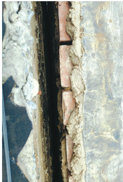
蝙蝠生活的伸缩缝。

“那是因为原来伸缩缝有一个水泥挡板能够遮阳，前几天把它拆除了，蝙蝠怕太阳晒，同时这段时间小区在安装防