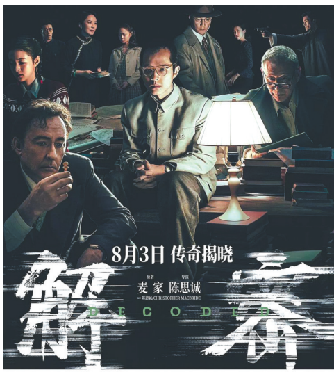
每个人都是独特的密码，这一生就是解密的过程