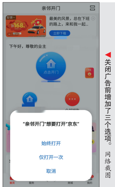
关闭广告前增加了三个选项。网络截图

示,“亲邻开门”已覆盖超过230个城市,进驻60000多个社区,服务7000多万家庭,合作物业超过12000个,包括大家熟悉的保利物业、中海物业、万科物业等。