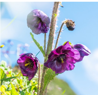
正在绽放的夹金山绿绒蒿。