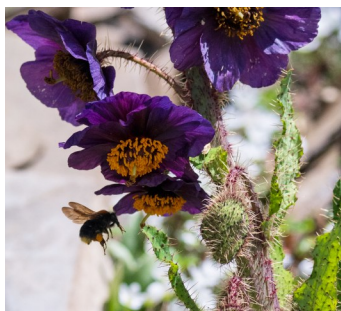
绿绒蒿花瓣形的“迷你温室”,吸引了传粉的昆虫。