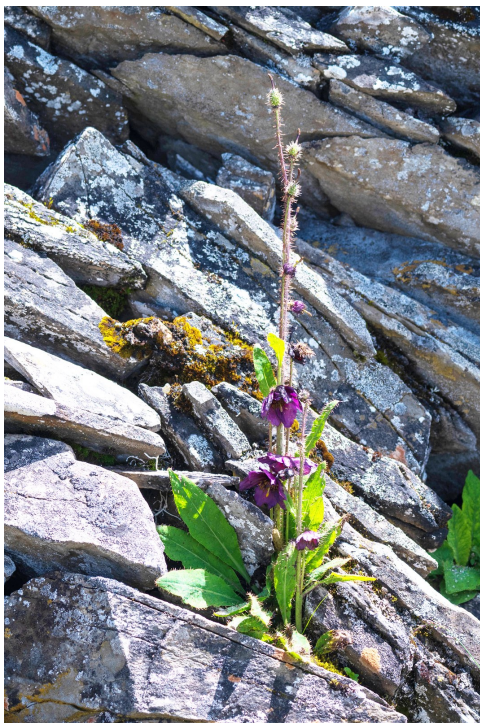
盛开在石头缝隙里的夹金山绿绒蒿。