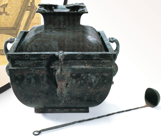
错金嵌松石龙耳铜方鉴与铜方罍。