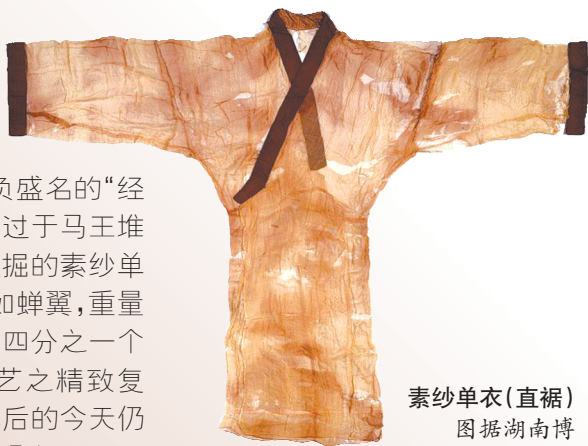
素纱单衣(直裾) 图据湖南博物院官网

古人夏季服饰中,最负盛名的“经典款”,莫过于马王堆汉墓中发掘的素纱单衣,它薄如蝉翼,重量仅相当于四分之一一个苹果,工艺之精致复杂在千年后的今天仍让人叹为观止。