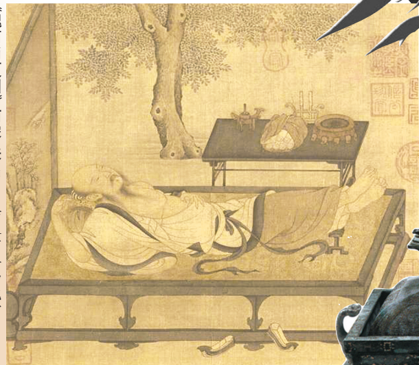
《槐荫消暑图》南宋佚名

唐朝人工储冰技术得到突破,终于实现了一年四季“用冰自由”。宋代,中国冷饮文化达到高峰,热闹非凡的集市上,宋人能品尝到绿豆冰、甘草冰、砂糖冰圆子等各种消暑饮品,和今天的夏日饮品相比毫不逊色。到了明清,冰镇酸梅汤、绿豆汤、杏仁豆腐等平民化冷饮更是风靡一时。