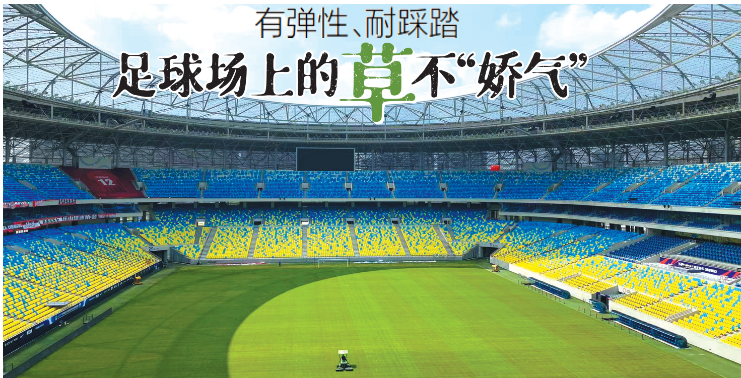
凤凰山专业足球场滚压“阴阳线”。

在成都也有这么一块足球场，凤凰山体育公园专业足球场，8月，这块草皮迎来了“新装”，也迎来了新草坪的第一场比赛。