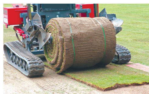
铺设草卷。