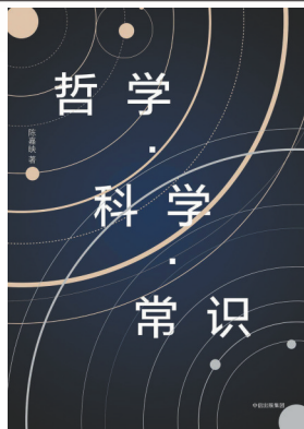
陈嘉映作品《哲学·科学·常识》。

2021年，做纪录片的朋友跟哲学家陈嘉映提议，要跟拍他的日常做一个哲学讨论主题的纪录片，陈嘉映的第一反应是拒绝的。在他看来，智性的深度对话，最好是发生在小范围高度信任的环境中。如果将之放在犹如汪洋大海的网络平台上，“落不下来”，而且他也顾虑，需要打开多个层面的哲学思考，会不会在互联网上容易出现“yes或no”简单思维一句话打发了。 但邀请陈嘉映的这两位朋友特别执着。陈嘉映最终答应做这部哲学纪录片。