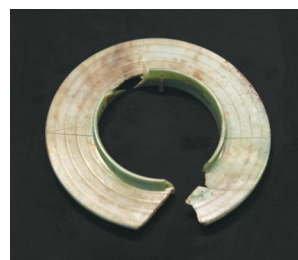
在三星堆博物馆文物保护与修复馆拍摄的有领玉璧。