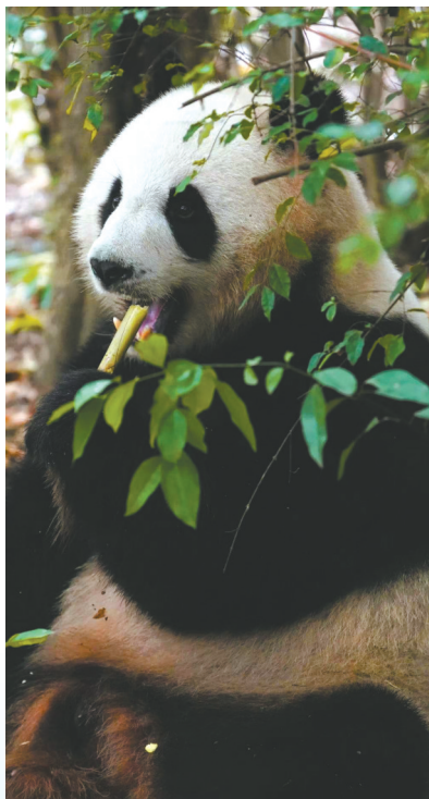
正在进食的大熊猫。

啃食竹子的大熊猫，拥有非常坚固强悍的牙齿，而且它们的牙齿还有一个神奇的功能——能够进行自动修复。2019年，科学家研究发现，大熊猫牙釉质在发生变形与损伤后，能在微米尺度进行自动修复。它们的牙齿之所以能够实现自动修复，主要得益于其牙釉质高密度、富含有机质的微观界面，以及巧妙的组织结构。