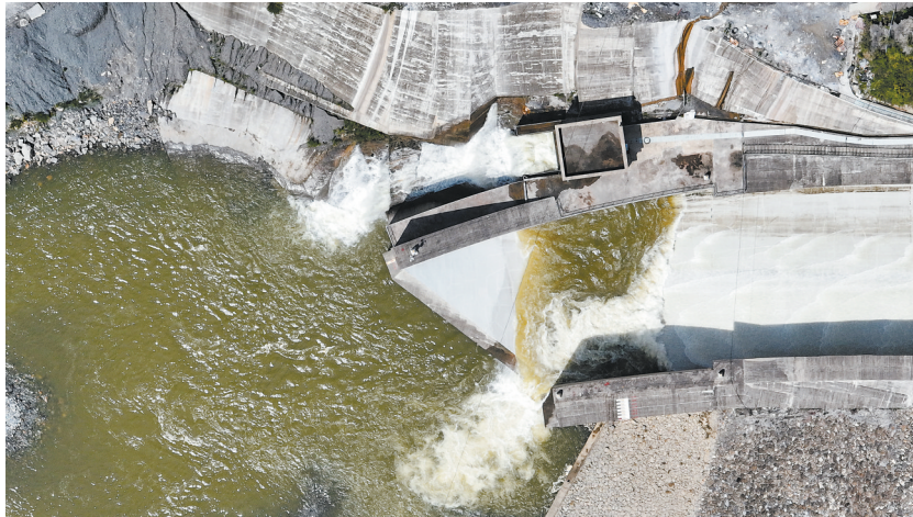
7月12日，红鱼洞水库开闸泄洪。