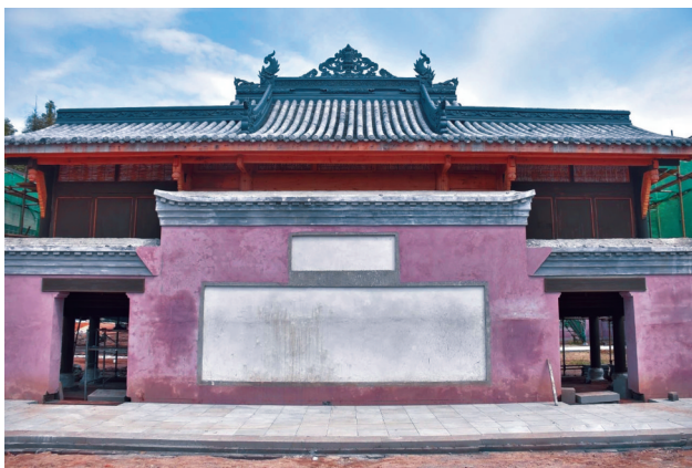
赵子龙祠墓修缮工程预计今年8月底总体完工。

大邑县文体旅局相关负责人介绍，此次修缮主要依照了1907年德国人恩斯特·柏施曼的测绘手稿，这份手稿标注了原祠墓具体的经纬度坐标，绘制了