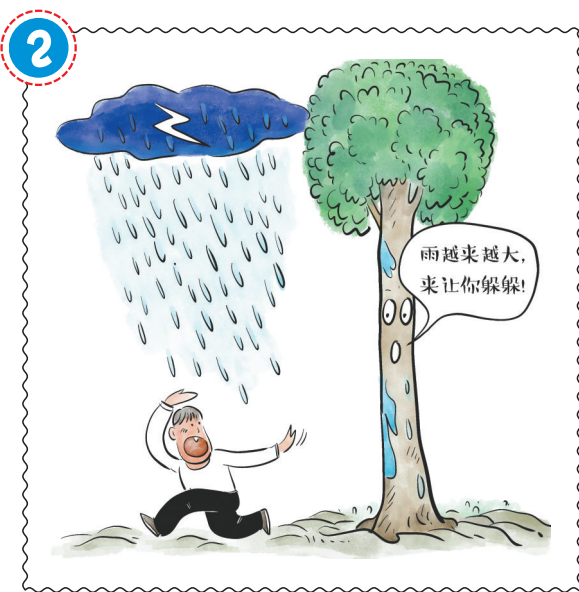
雷雨天气外出尽量保持与高大树木、广告牌的安全距离。