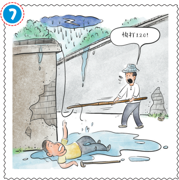
发现有人触电, 应及时切断电源, 在保证自身安全前提下将触电者迅速转移至安全地带平躺并拨打120急救电话。