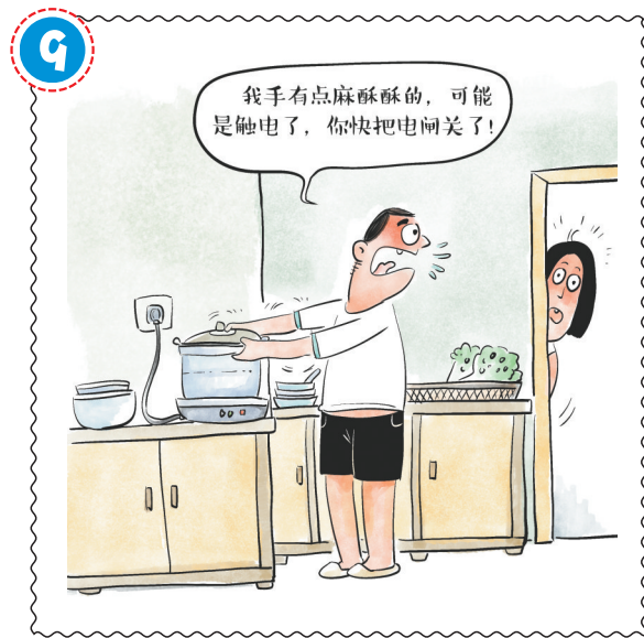
在家用电出现酥麻感时, 应立即停止手中动作, 切勿走动, 以防形成跨步电压导致触电, 并马上让家人关闭电源。