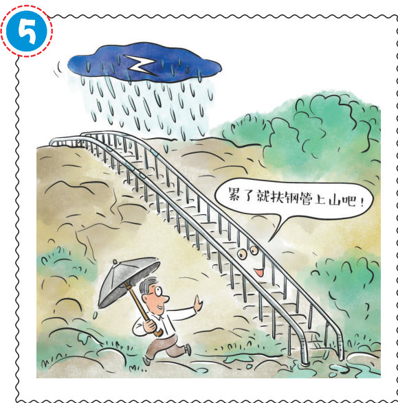
应避免在雷雨天气下接触金属外壳的公共设施, 特别是在空旷地带或高处。