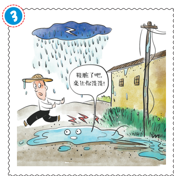
雷雨天气行走尽量避开积水路段, 如果必须涉水, 应事先观察是否有电线等可疑物。