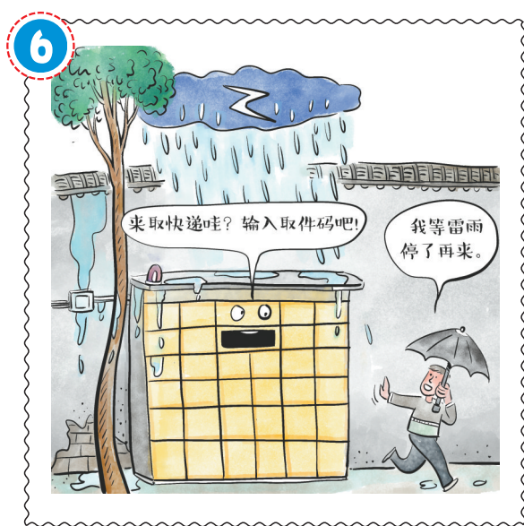
雷雨天气, 应用防雨器具遮盖住快递柜带电部分, 在确保没有安全隐患情况下打开快递柜。