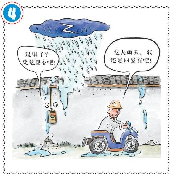
应尽量避免在雷雨天气下使用户外充电设施, 如果使用应确保充电设施具有防水功能。