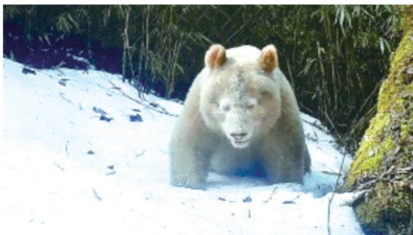
2023年5月27日,四川卧龙国家级自然保护区管理局发布目前监测到的全球唯一白色大熊猫的正脸照。