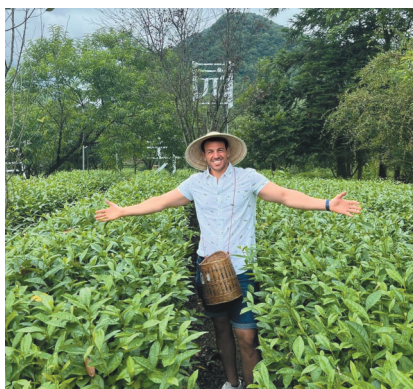
埃及的拉米在ins上分享他在茶园采茶的图文和视频。