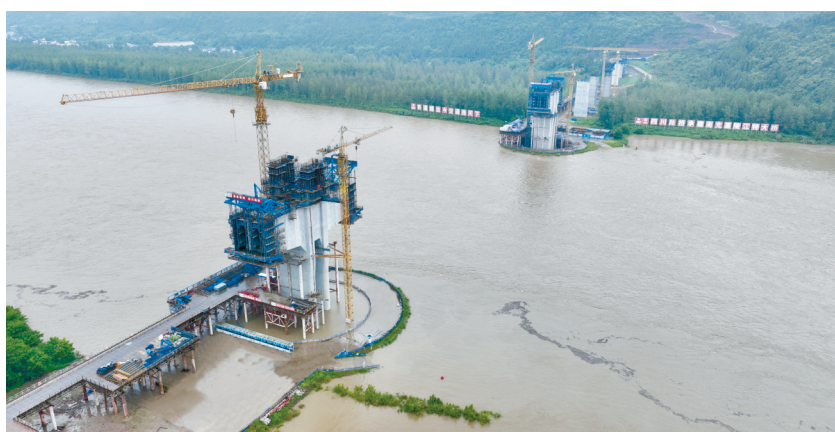
7月8日,洪水中的成达万高铁嘉陵江特大桥项目现场。

成达万高铁嘉陵江特大桥总共设计161个桥墩,随着主梁建设推进,成达万高铁嘉陵江特大桥建设已进入冲