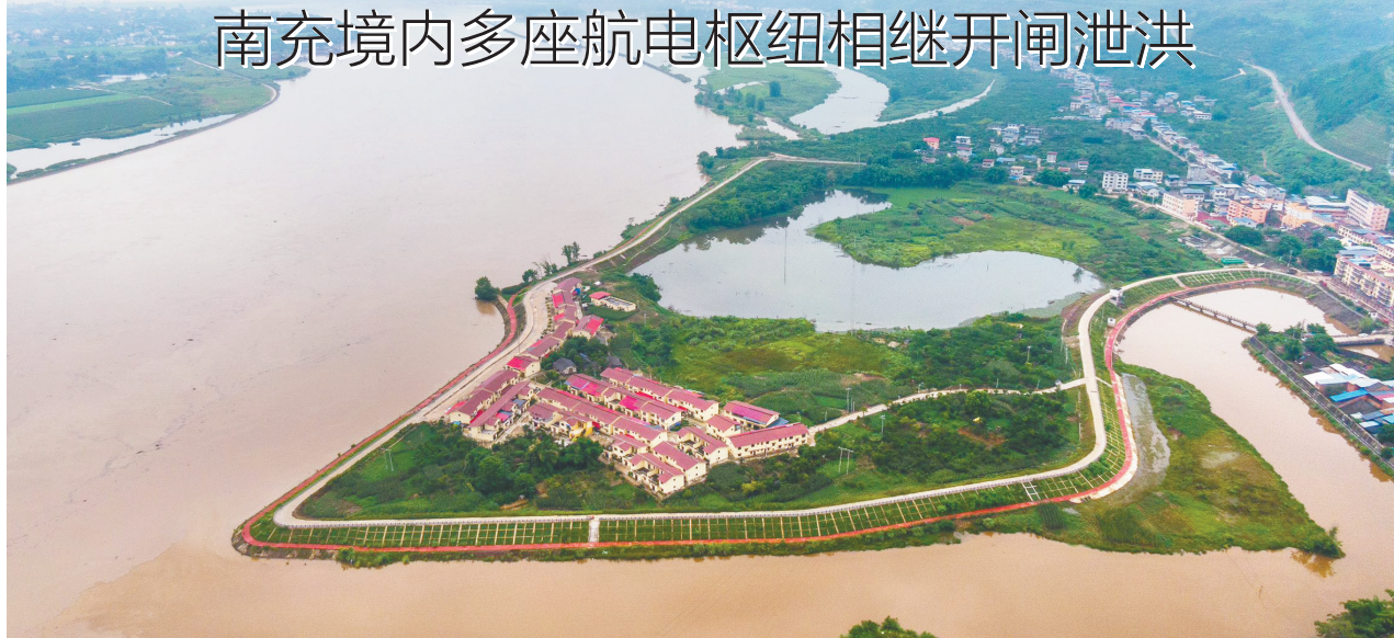
7月8日，嘉陵江边的凤仪湾水位明显上涨。

华西都市报(杨波 记者 谢杰)7月7日至8日,受持续暴雨影响,嘉陵江上游及支流水位上涨。8日上午10时许,嘉陵江南充段迎来2024年首次洪峰过境,最大来水量达6390立方米/秒,南充境内多座航电枢纽相继开闸泄洪。