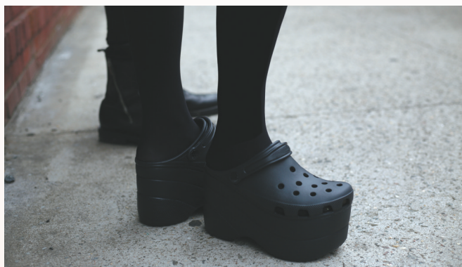
2019年纽约时装周上明星穿着的厚底洞洞鞋。