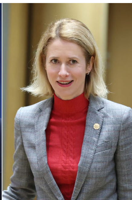
这是欧盟委员会主席冯德莱恩（左）、时任葡萄牙总理科斯塔（中）和爱沙尼亚总理卡拉斯的资料照片。

欧盟峰会6月27日在比利时首都布鲁塞尔举行，欧洲理事会当晚通过欧盟新领导层人选。分析人士指出，自6月上旬欧洲议会选举结束后，各方经过半个多月博弈，最终确定下一届欧盟机构领导层人选。但提名人选尤其是欧盟委员会（欧委会）主席冯德莱恩的连任能否获得欧洲议会的过半数支持，仍存悬念。