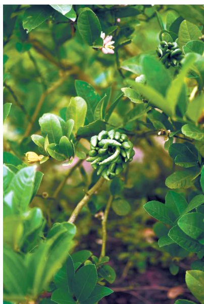
蓬溪县种植的中药材佛手。

黄。本草的神奇，在于随着草药生长，药性也在变化。而本草文化在蓬溪的传承，亦如草药生长一般，在悠长的时光中推陈出新。