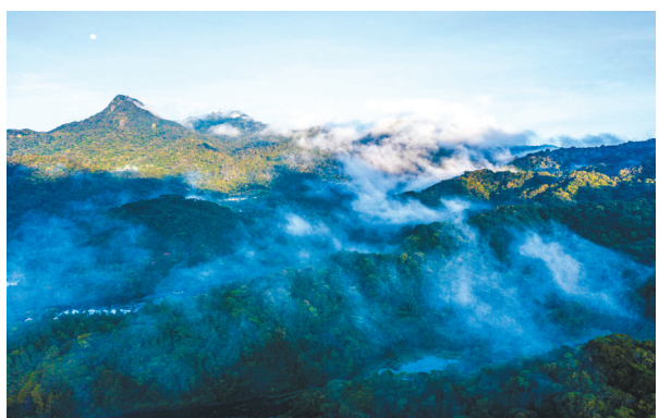
海南热带雨林国家公园尖峰岭片区。