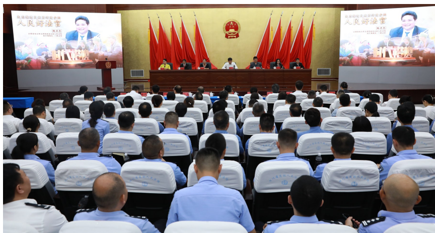
6月18日,“时代楷模”鲍卫忠先进事迹报告会在省法院举行。

情感,从不同角度深情讲述了鲍卫忠的先进事迹,追忆他司法“卫”民、竭“忠”尽智的一生。