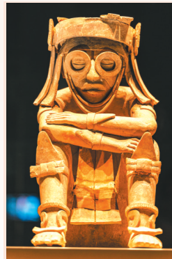
雨神特拉洛克石雕(公元600-1521年纳瓦文化) 卡洛斯·裴里瑟·卡玛拉人类学博物馆藏

此外，展览中最为世人所熟知的玛雅文明，从公元前500年持续到1100年。展览中，展出了多件来自玛雅文化的祭祀用陶香炉架，其上不仅有人形