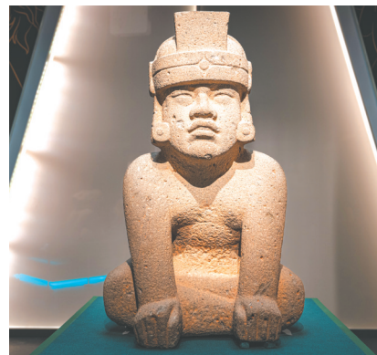
“王子”豹人石雕(公元前1200-前900年奥尔梅克文化) 哈拉帕人类学博物馆藏