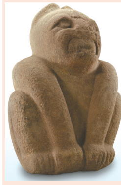
美洲豹形石雕(公元前1200-前900年奥尔梅克文化) 哈拉帕人类学博物馆藏