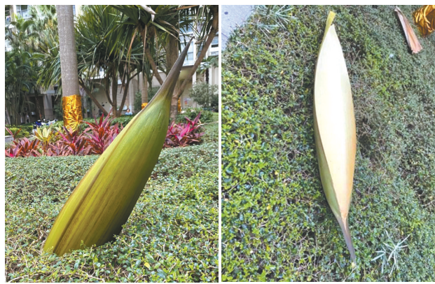
掉落的大王椰树叶。