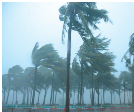
大王椰具有极强的抗风性。