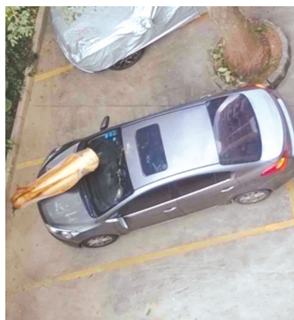
大王椰树叶砸中汽车车头。