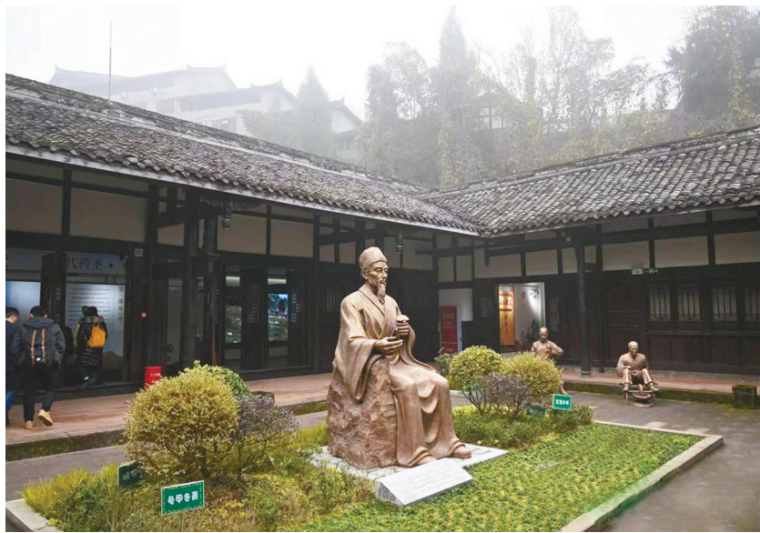
蓬溪县时珍中医文化馆。入当代社会，融入日常生活，走进寻常百姓家，发挥其最大的文化功能。