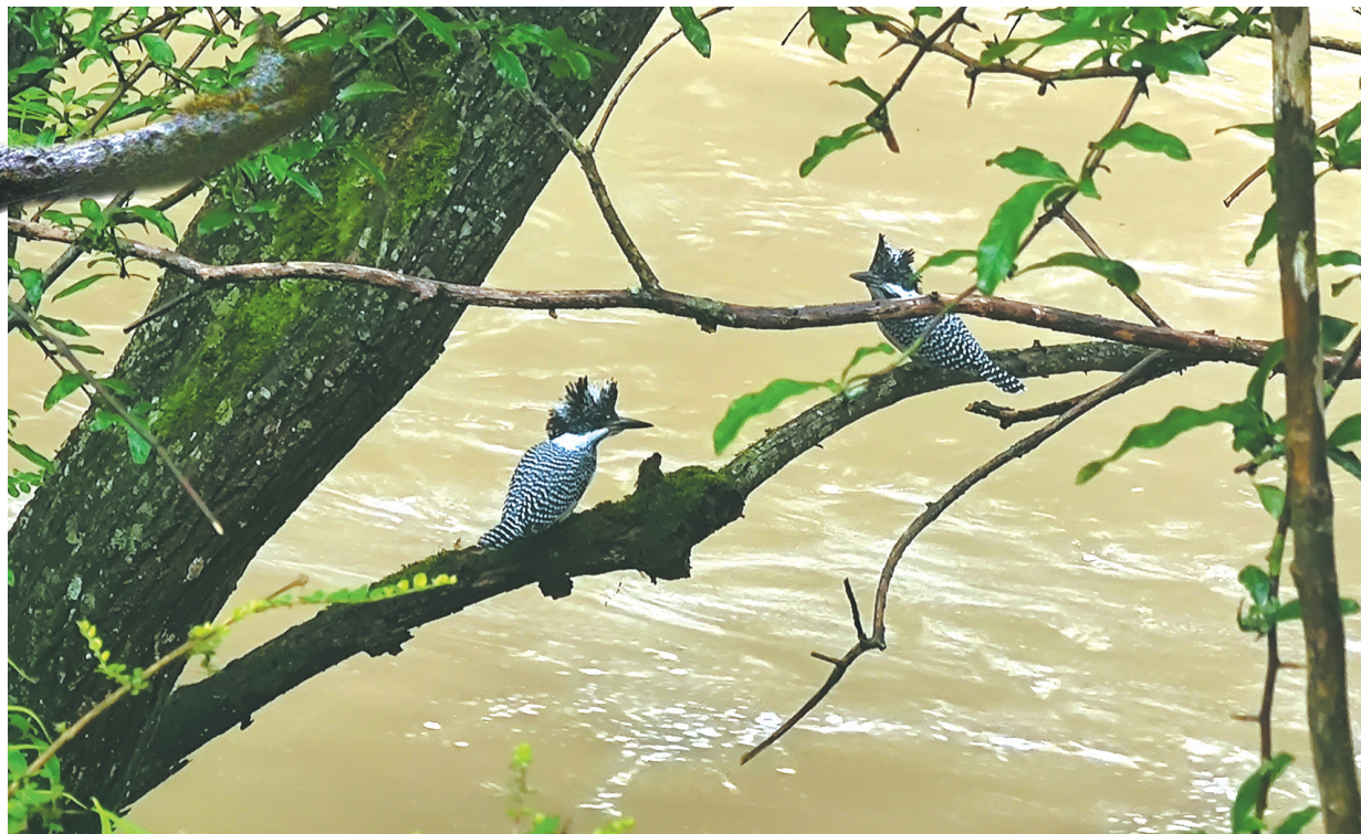
冠鱼狗常住在小河溪流附近，以捕鱼为生。

最近，一只黑白色动物现身四川绵阳一高校，引发关注。在查明其身份后，这个小家伙的名字——“冠鱼狗”令网友们感到好奇：它究竟是鱼，还是狗呢？