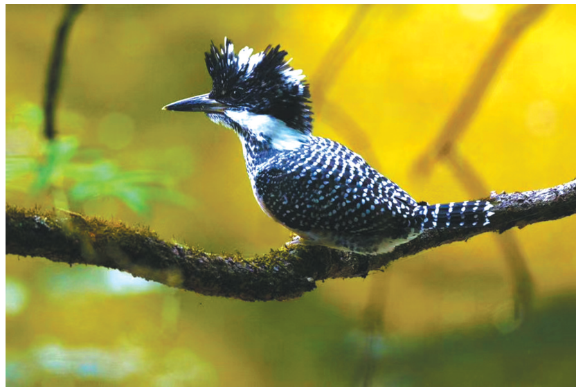
冠鱼狗最显著的特点是“头戴羽冠”。

“鱼”，则主要是说它们以鱼类为食。大鱼狗属的鸟类主要以鱼类为食，冠鱼狗也不例外。在它们的食谱中，小鱼是其最主要食物，甲壳类和多种水生昆虫及其幼虫为辅食，也包括少量的水生植物。“狗”，则是因为爱吃鱼的冠鱼狗，在水边观察等候小鱼出现时的样子，像极了猎狗蹲伏捕猎，而且它们警觉灵敏也高，颇似猎狗。