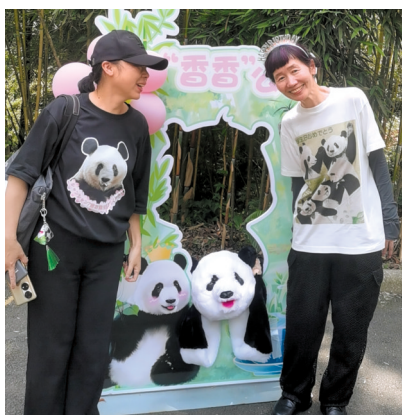
日本粉丝为“香香”庆生。

“别发出太大的声音,不要吓到她。”人群中,有人小声地用日语叮嘱着同伴。当娇憨的“香香”现身林间时,他们欢快地低呼着,同时高举照相机,争先恐后地按下快门。