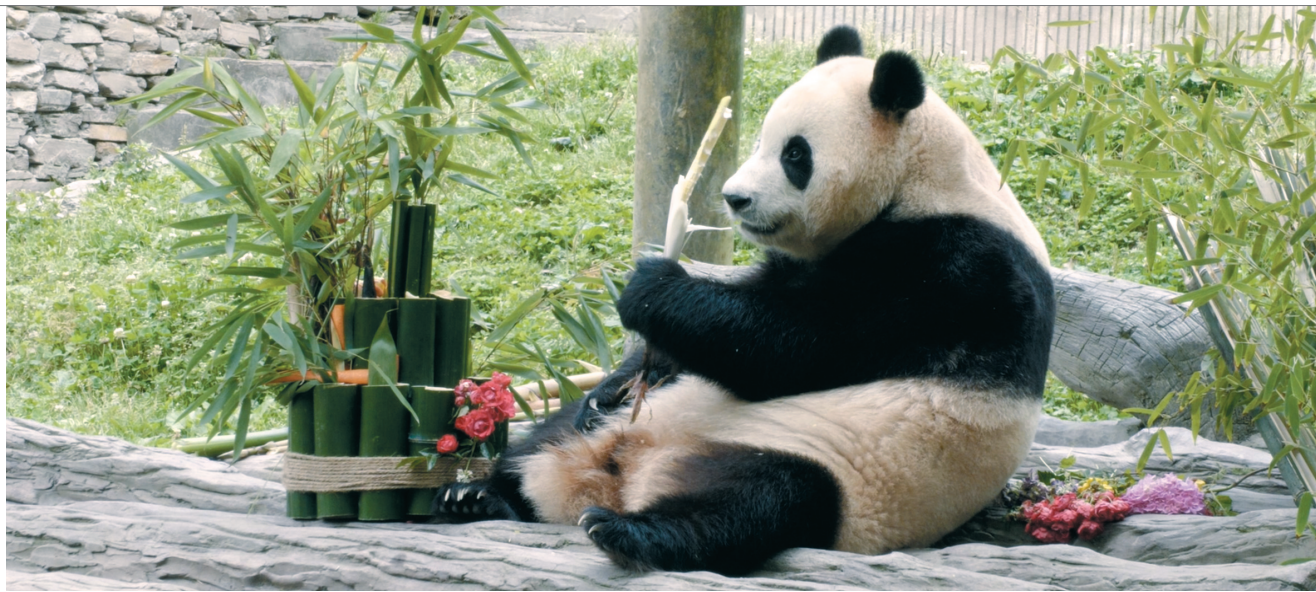
6月12日,中国大熊猫保护研究中心卧龙神树坪基地,大熊猫“福宝”开启“吃播”模式。周彬 摄

在6月11日举行的中外媒体见面会上,中国大熊猫保护研究中心副主任魏荣平透露,饲养员每天会为“福宝”投5到6