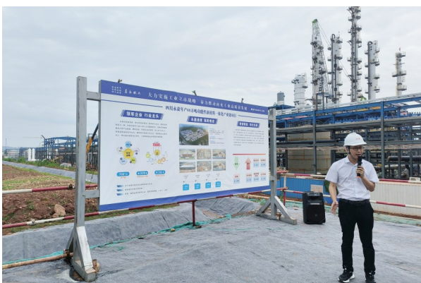
▲南充永盈80万吨功能性新材料一体化产业链项目建设现场。