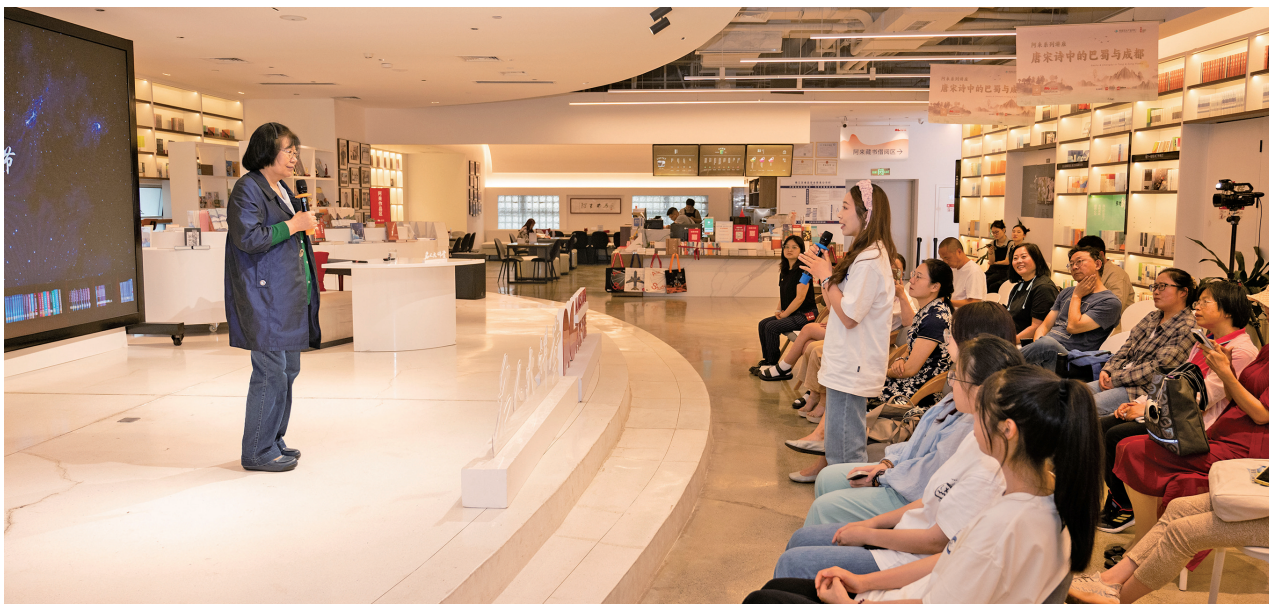
韩茂莉教授对话传习志愿者。