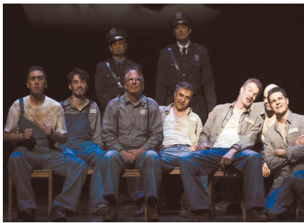
话剧《肖申克的救赎》中文版演出照。