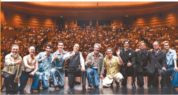
话剧《肖申克的救赎》演员与成都观众合影。

“希望是个美好的梦，只要希望还在，美梦就会成真。”5月17日、18日晚，备受瞩目的话剧《肖申克的救赎》中文版在成都高新中演大剧院上演。这部由张国立执导，全外国演员、全中文对白呈现的经典之作，再次将斯蒂芬·埃德温·金笔下的温情与希望带到观众面前。舞台上，来自8个国家的11位外籍演员以一口流利的汉语，生动诠释了这部耳熟能详的故事。其中，加拿大籍演员大山以精湛的演技和独特的魅力，成功塑造了“瑞德”这一经典角色。演出前夕，大山接受华西都市报、封面新闻记者专访，分享他对角色、对《肖申克救赎》、对中西文化交流的心得感受。