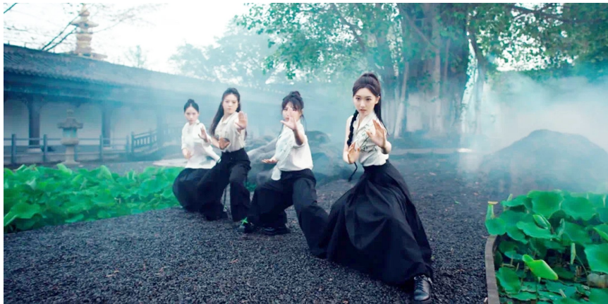
峨眉派女子功夫团表演武术。视频截图