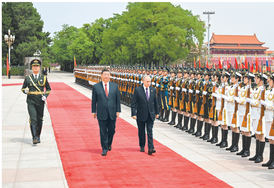
5月16日上午,国家主席习近平在北京人民大会堂同来华进行国事访问的俄罗斯总统普京举行会谈。这是会谈前,习近平在人民大会堂东门外广场为普京举行隆重欢迎仪式。

新华社北京5月16日电 5月16日上午,国家主席习近平在北京人民大会堂同来华进行国事访问的俄罗斯总统普京举行会谈。