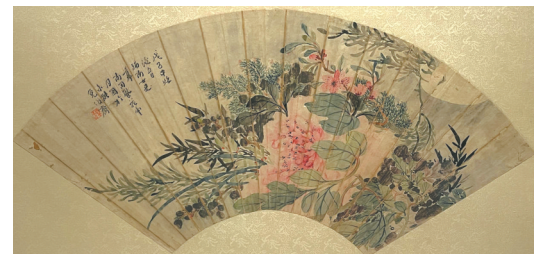
曾兰芳设色花卉扇面。

细心感受展览就会发现，这些精美的扇面除了静静躺在展柜中，从高处垂下的纱幔，还将扇面上顾盼生姿的仕女、缤纷灿烂的花卉融入其上，在纱幔与光影之间更能感受扇面的风韵。