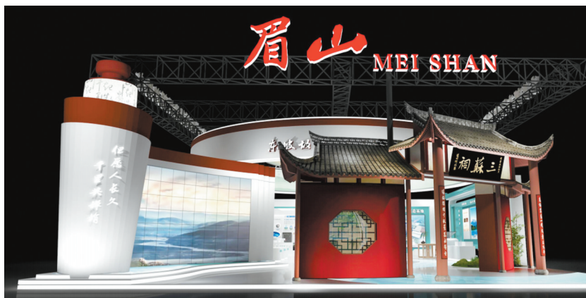
2024年“中国品牌日”眉山馆。

进入场馆，设计成水滴造型的多媒体设备引人注目。“一滴水可以见太阳，一个三苏祠可以看出我们中华文化的博大精深。我们说要坚定文化自信，中国有‘三苏’，这就是一个重要例证。”2022年6月8日，习近平总书记记