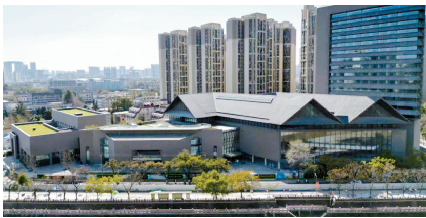
四川大学博物馆新馆。

博物院新馆，系宜宾最大的文物收藏、保护、研究、展示利用及非物质文化遗产保护业务工作单位。该院展厅面积6100平方米，分为《我住长江头》《四季乡愁》《酒都酒风》《墨韵三江》和一个临展厅。现有馆藏文物1.2万件，其中珍贵文物1471件。