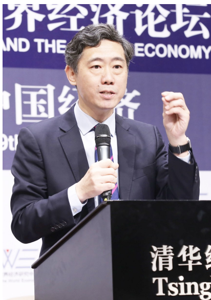
清华大学中国经济思想与实践研究院院长李稻葵