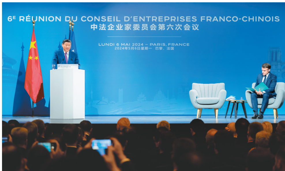
当地时间5月6日下午，国家主席习近平在巴黎同法国总统马克龙共同出席中法企业家委员会第六次会议闭幕式，并发表题为《继往开来，携手开创中法合作新时代》的重要致辞。

习近平指出，今年是中法建交60周年。60年，在中国传统历史中是一个甲子的轮回，寓意着承前启后、继往开来。60年来，中法是真诚的朋友。两国秉持独立自主、相互理解、高瞻远瞩、互利共赢的建交精神，成为不同文明、不同制度、不同发展水平的国家相互成就、共同前进的典范。60年来，中法是共赢的伙伴。中国已经成为法国在欧盟外的第一大贸易伙伴，两国经济已经形成你中有我、我中有你