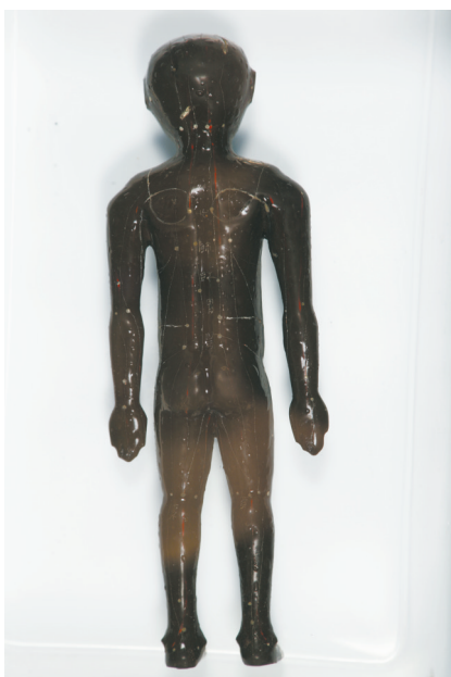
老官山汉墓出土的髹漆人体经穴俑。