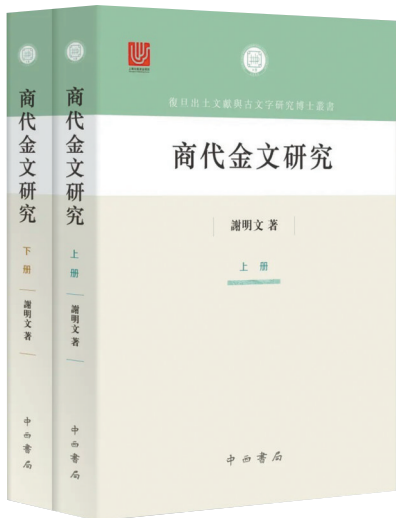
谢明文著《商代金文研究》。

师长尚如此，裘锡圭门下的学生更是“不敢懈怠”。谢明文对于学术就像裘先生那样痴迷，甚至到了不分生活与学术时间的地步，久而久之，“老裘时间