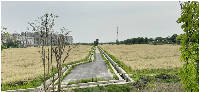
成都环城生态区的油菜黄了。