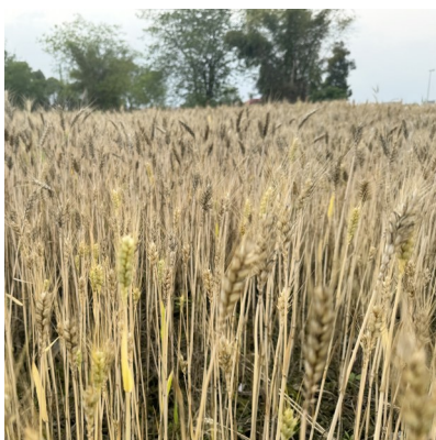
部分麦田的麦子也可以收割了。

一个月前曾刷爆成都人朋友圈的“油菜花海”，已经进入落黄成熟期。4月25日，家住青羊区蔡桥街道附近的居民向华西都市报、封面新闻“云求助”栏目反映，成都环城生态区10余万亩农田内的小春作物迎来了成熟丰收季，但目前还没看到大范围收割，担心油菜小麦如果遇到降雨会导致作物受损、产量减少。