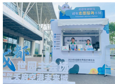
2024成都世园会城市志愿服务小站。

此外，共青团成都市委还将依托30个城市志愿服务小站，积极开展“青春志愿”系列志愿服务，并通过“青聚锦官城”志愿平台对外发布项目，组织动员青年广泛参与“人人都是志愿者”“当好东道主、热情迎嘉宾、建好幸福城”的志愿者服务活动。