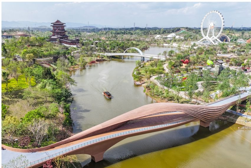
一艘游船行驶在成都世园会主会场绛溪河上（4月22日摄，无人机照片）。

为方便游园，2024成都世园会主会场设置了3个游客出入口，设有特殊人群绿色通道和无障碍设施，提供物品寄存、轮椅、婴儿推车服务。