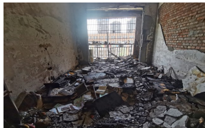
失火住户家中一片狼藉。