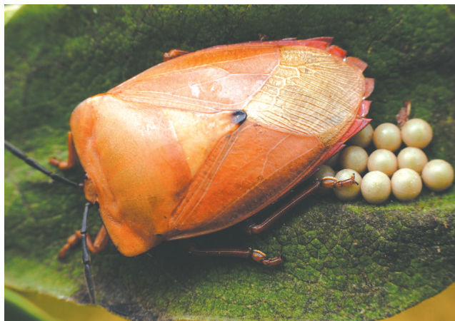
正在产卵的荔枝。

除此之外，在晚上晾晒衣物时，最好不要在附近开灯。因为昆虫的趋光性，灯光会吸引荔枝的到来。而且，除了荔枝，蛾类昆虫也可能被灯光吸引来产卵。