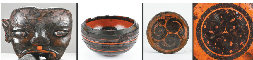
武王墩主墓室出土的部分漆器。