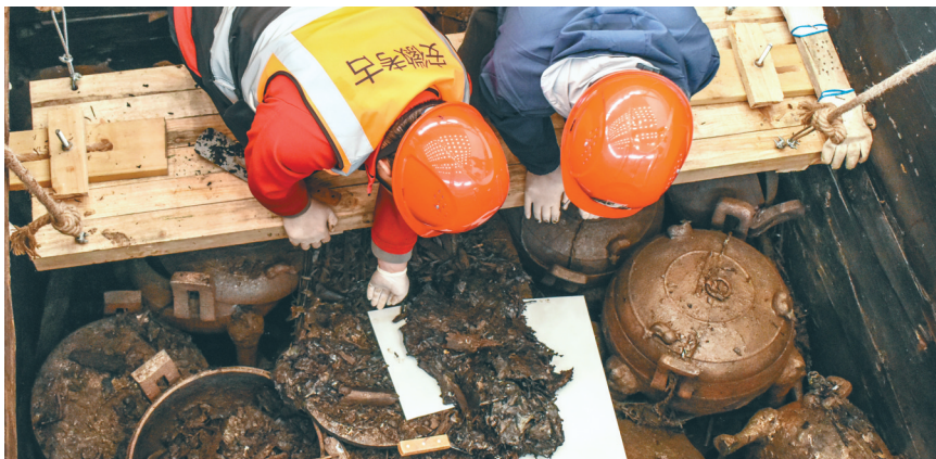
考古工作者在安徽淮南武王墩主墓内提取脆弱的文物（2024年4月6日摄）。

主墓（一号墓）为一座大型“甲字形”竖穴土坑墓。封土堆整体呈覆斗状，总面积约1.2万平方米。墓坑近正方形，边长约50米，墓坑东侧有长约42米的斜坡墓道。这在目前发掘的楚墓中也是最大的。