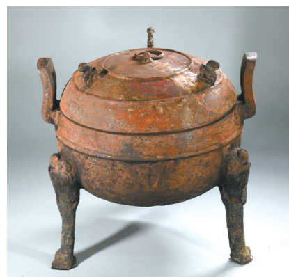
武王墩主墓出土的部分青铜器。

证。专家表示，此次考古发掘将进一步寻找楚简、大型青铜器铭文等关键证据作为墓主身份的认定。