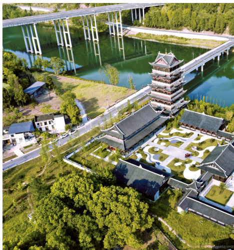
紧邻文宗苑的龙宝大桥。