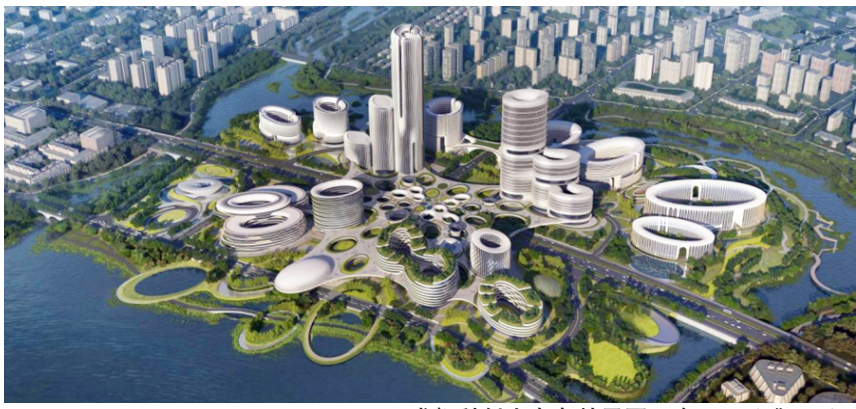
成都科创生态岛效果图。

这片建设目标为“全国首家千亿级数字经济近零碳产业园区”的空间,由多个高度不同的圆弧形建筑构成,像一个“圆形细胞体”有序排列,经由空中