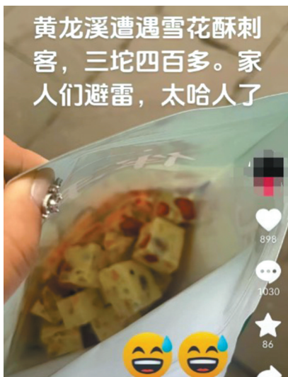
游客吐槽成都黄龙溪某门店雪花酥价格太贵。