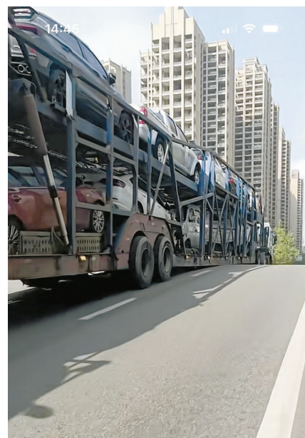
大货车底盘卡在公路坡道上,动弹不得。